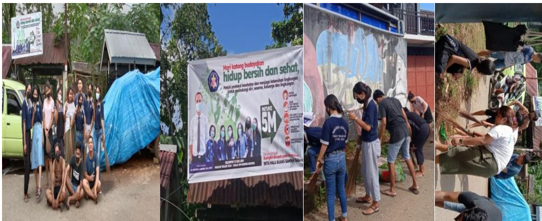
Gambar 3. Pemasangan Spanduk dan Pembersihan Lingkungan Bersama AMGPM Ranting Zaitun

Kegiatan ini juga melibatkan angkatan muda ranting zaitun, angkatan muda ranting eben, beberapa jemaat di Wilayah Sektor Irene dan Sektor Tiberias. Jemaat memang sangat peduli terhadap kebersihan lingkungan, akan tetapi masih saja ada sebagian orang yang tidak peduli terhadap kebersihan lingkungan dengan membuang sampah sembarangan, untuk itu kelompok mengangkat program pemasangan spanduk sebagai upaya mengajak jemaat untuk hidup peduli terhadap kebersihan lingkungan.