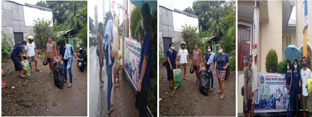
Gambar 4. Aksi Kebersihan Lingkungan dan Pemasangan Spanduk Bersama Angkatan Muda Ranting Ebed