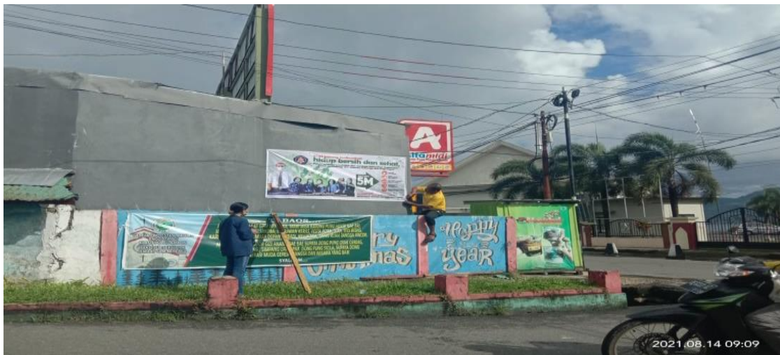
Gambar 5. Pemasangan Spanduk di Sektor Tiberias Jemaat GPM Nehemia