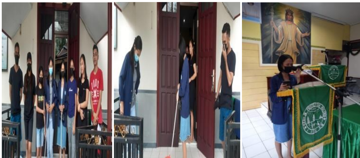
Gambar 6. Hibauan Tentang Protokol Kesehatan dan Kebersihan Lingkungan di BK Benteng Jemaat GPM Nehemia

Di dalam himbauan tersebut kami selalu mengingatkan kepada jemaat agar selalu mematuhi Protokol kesehatan. PROKES ini dikenal dengan sebutan 5M. Sudah tahu apa saja protokol kesehatan 5M untuk membantu pencegahan penularan virus corona.