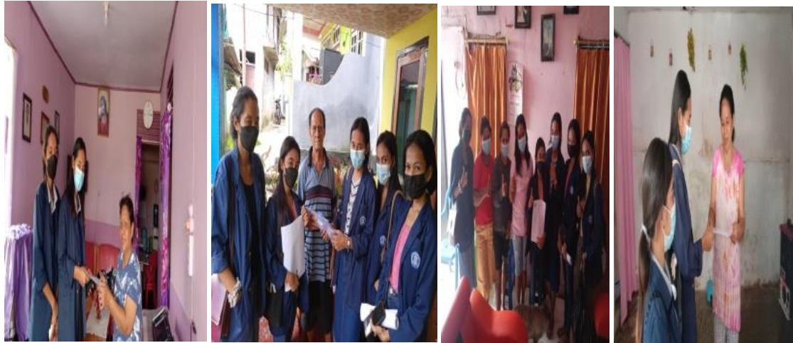
Gambar 1. Pendataan dan Pembagian Masker bagi Jemaat