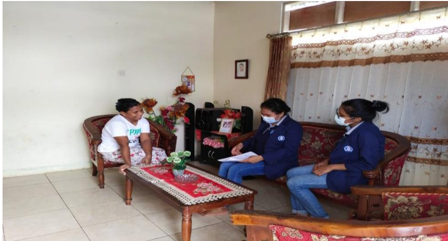
Gambar 1. Pembagian Kuesioner

Mencermati pemahaman warga jemaat yang masih keliru tentang protokol kesehatan dan vaksinasi, maka sosialisasi yang dilakukan bertemakan “ Taat Protokol Kesehatan dan Pentingnya Vaksinasi ”. Sosialisasi ini dilakukan dengan bekerja sama dengan pihak kesehatan dari Puskesmas Air Salobar. Kelompok memasukan surat di Puskesmas Air Salobar pada Jumat 6 Agustus 2021, dan hari itu juga surat diterima dan kelompok melakukan percakapan dengan dokter. Dari percakapan yang dibangun kelompok mencoba menyampaikan tema dari sosialisasi yang akan dilakukan dan berbagai pertanyaan warga jemaat dari hasil kuesioner. Hal ini dilakukan karena sosialisasi yang dilakukan satu arah sehingga tidak adanya percakapan atau pertanyaan dari warga jemaat, dari penjelasan tenaga medis bisa menjawab kegelisahan atau ketidaktahuan warga jemaat yang ada di Kuesioner.