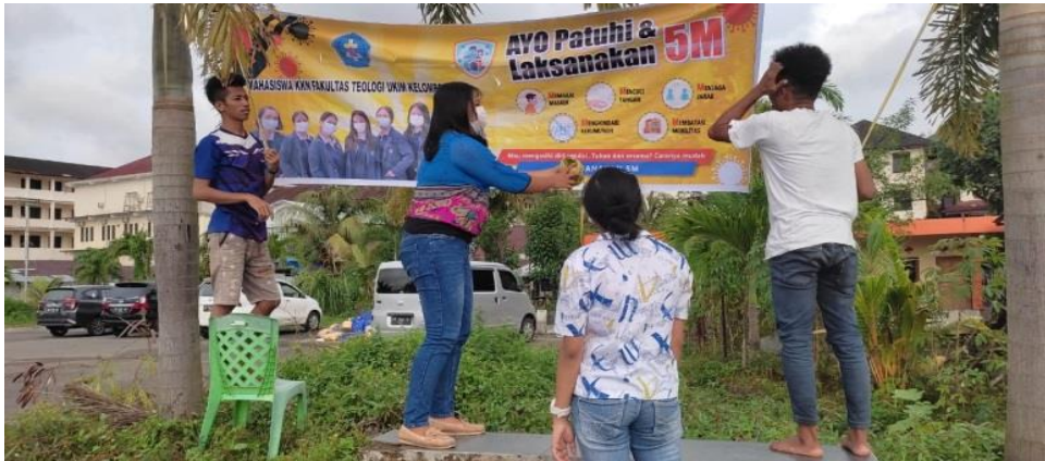
Gambar 8. Pemasangan Spanduk di Sektor Galilea