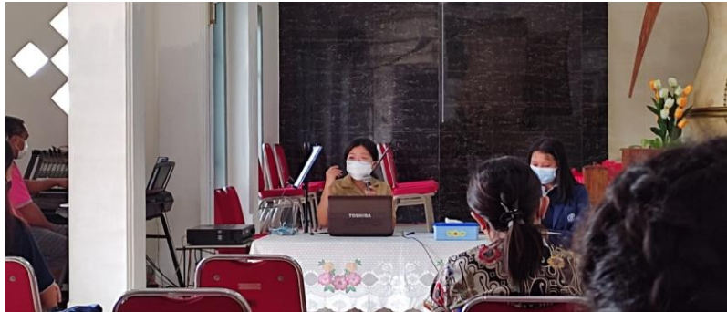
Gambar 3. Proses Sosialisasi

Dengan adanya program ini warga jemaat Sumber Kasih memiliki pengetahuan yang lebih tentang disiplin prokes 5M dan juga teredukasi tentang manfaat vaksin.