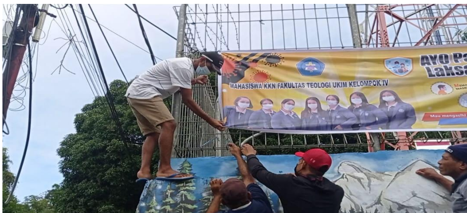
Gambar 7. Pemasangan Spanduk di Sektor Sumber Kasih

Pemasangan yang dilakukan oleh kelompok pada empat titik pelayanan yakni di sektor Sumber kasih, sektor Elefantin, sektor Bethania dan sektor Galilea. Hal ini diharapkan agar jemaat dapat menaati protokol kesehatan dengan baik sehingga dapat melindungi diri serta dapat membantu pemerintah dalam memutus rantai penyebaran COVID-19 secara bersama-sama.