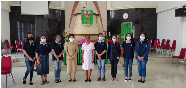
Gambar 4. Foto bersama Nakes dan Pendeta

Sosialisasi ini juga dilakukan di waktu yang tepat karena pada tanggal 12 Agustus 2021 ada dilakukan program vaksin di jemaat Rehoboth. Hasil dari sosialisasi ini membuat warga jemaat lebih paham sebelum mengikuti program vaksinasi yang dilakukan oleh jemaat GPM Rehoboth yang bekerja sama dengan pihak Karumkit Bhayangkara kota Ambon, pada 12 Agustus 2021. Ada 50 orang dari sumber Kasih yang di vaksin. 35 orang dari unit 1 dan 15 orang dari unit 2.