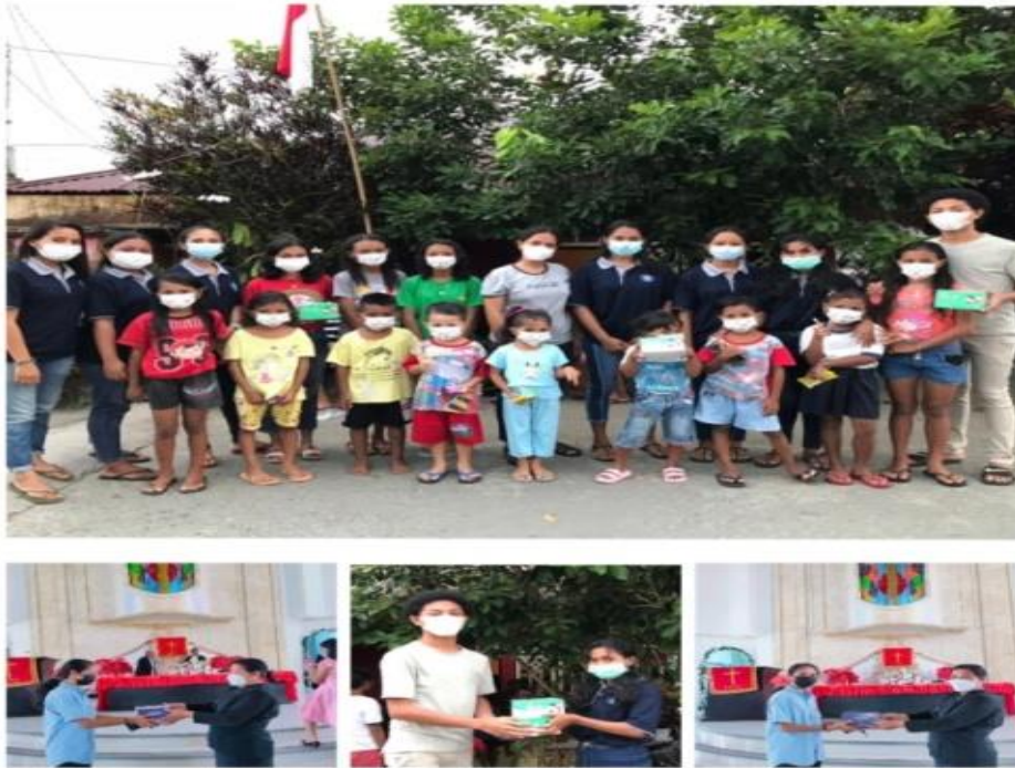
Gambar 2. Pembagian Masker

Dari 22 pack masker yang ditargetkan 15 pack untuk Deswasa dan 7 pack untuk anak-anak semuanya tersalurkan = 100% berhasil. Jadi untuk luaran yang ditergetkan kelompok 100% berhasil terlaksana.