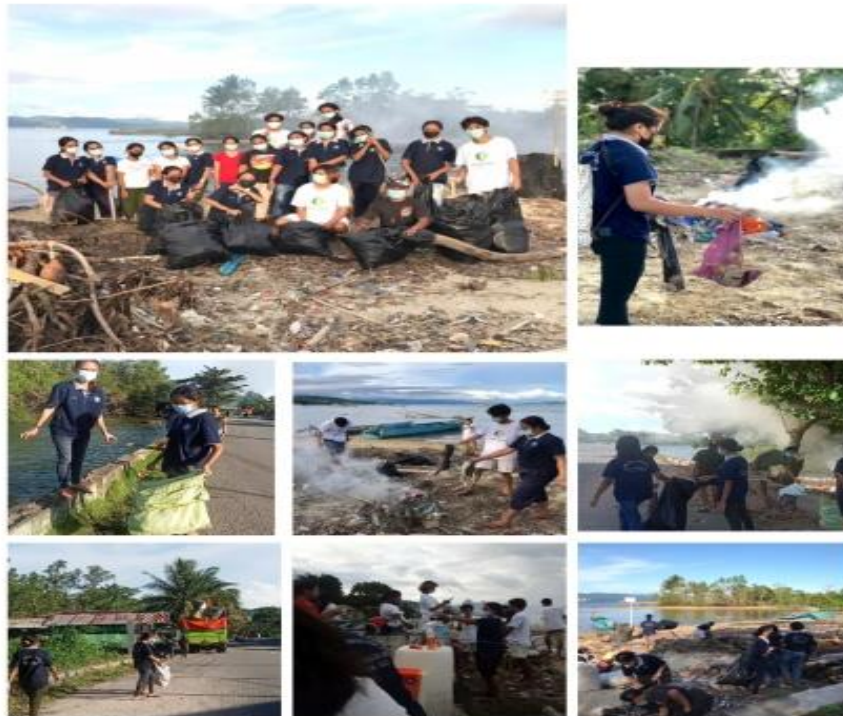
Gambar 3 Pemungutan Sampah