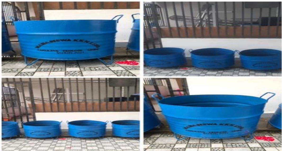
Gambar 5. Pembuatan sampah