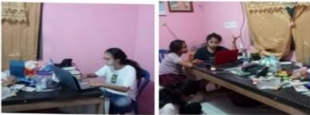
Gambar 6. Pembuatan Video Kreatif