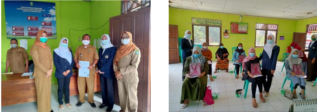
Gambar 6. Pemberian Souvenir dan Foto Bersama

dengan pihak-pihak terkait seperti puskesmas dan profesi lain (dokter dan ahli gizi, dll) dalam upaya peningkatan kesehatan secara holistic.