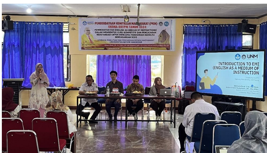
Gambar 2. Sosialisasi Pengabdian

Sosialisasi bertujuan untuk memperkenalkan konsep dan pentingnya English Medium Instruction (EMI) kepada seluruh staf pengajar dan administratif di sekolah. Dalam pelaksanaannya, sosialisasi ini dilakukan melalui koordinasi antara kepala sekolah dan guru bahasa Inggris, yang berperan sebagai fasilitator utama. Melalui kegiatan ini, guru-guru dan staf diharapkan memahami bahwa penggunaan bahasa Inggris sebagai bahasa pengantar bukan hanya sekadar kebutuhan linguistik, tetapi juga strategi peningkatan kualitas pendidikan yang selaras dengan standar global. Kegiatan sosialisasi dapat meliputi pertemuan, diskusi kelompok, dan presentasi yang menguraikan manfaat EMI serta tantangan yang mungkin dihadapi, sehingga para guru dan staf mendapatkan gambaran yang jelas mengenai tujuan dan dampak jangka panjang dari implementasi EMI dalam proses pembelajaran.