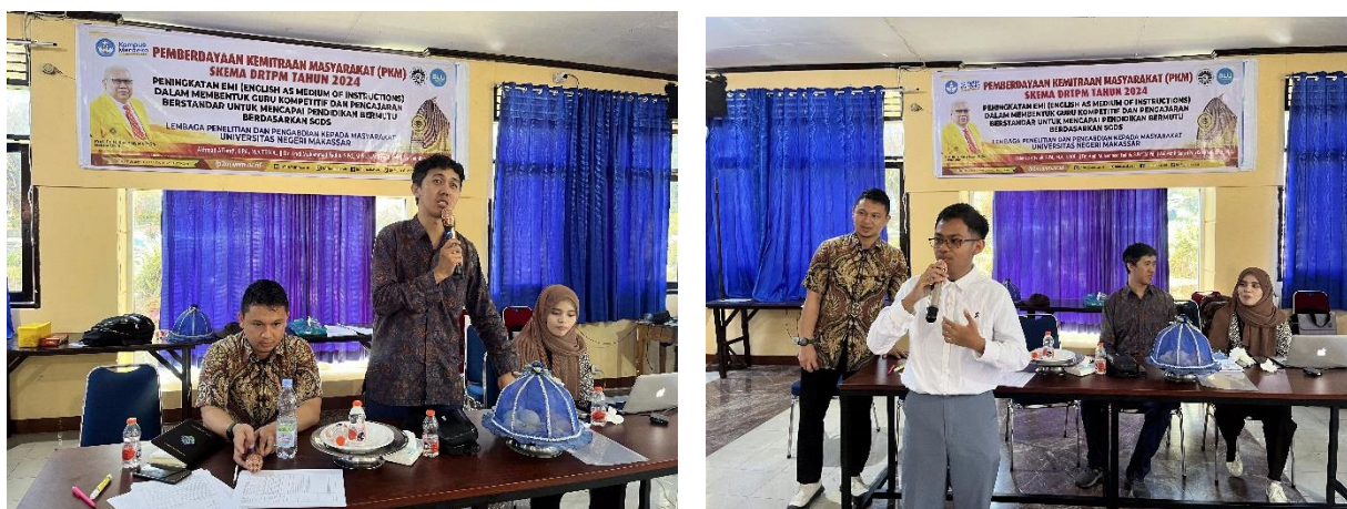
Gambar 3. Pelatihan EMI

Metode pelatihan dirancang untuk membekali guru dengan keterampilan dan strategi yang diperlukan untuk mengajar dengan bahasa Inggris secara efektif. Pelatihan ini mencakup sesi yang memperhatikan persepsi guru terhadap EMI, menyajikan latihan praktis yang berfokus pada peningkatan kemampuan mengajar dalam bahasa Inggris, dan membahas dampak EMI terhadap identitas profesional guru. Selain itu, kolaborasi interdisipliner didorong untuk memungkinkan pertukaran praktik terbaik antar guru, serta penekanan pada keberlanjutan pelatihan hingga EMI menjadi bagian normal dalam kegiatan pengajaran. Pendekatan ini memastikan bahwa program pelatihan tidak hanya memberikan keterampilan teknis tetapi juga membangun kepercayaan diri dan kesadaran akan peran penting EMI dalam pengajaran.