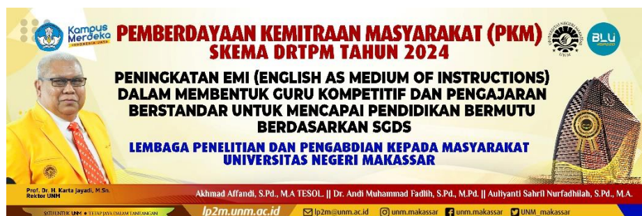
Gambar 1. Spanduk DRTPM

Sosialisasi bertujuan untuk memperkenalkan konsep dan pentingnya English Medium Instruction (EMI) kepada seluruh staf pengajar dan administratif di sekolah. Dalam pelaksanaannya, sosialisasi ini dilakukan melalui koordinasi antara kepala sekolah dan guru bahasa Inggris, yang berperan sebagai fasilitator utama. Melalui kegiatan ini, guru-guru dan staf diharapkan memahami bahwa penggunaan bahasa Inggris sebagai bahasa pengantar bukan hanya sekadar kebutuhan linguistik, tetapi juga strategi peningkatan kualitas pendidikan yang selaras dengan standar global. Kegiatan sosialisasi dapat meliputi pertemuan, diskusi kelompok, dan presentasi yang menguraikan manfaat EMI serta tantangan yang mungkin dihadapi, sehingga para guru dan staf mendapatkan gambaran yang jelas mengenai tujuan dan dampak jangka panjang dari implementasi EMI dalam proses pembelajaran.