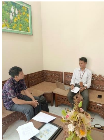
Gambar 2. Diskusi Persiapan

Metode pelaksanaan kegiatan ini dimulai dengan tahap perencanaan dan persiapan. Pada tahap ini, tim proyek akan melakukan identifikasi tujuan dan sasaran dari proyek videografi. Tujuan utama adalah untuk meningkatkan profil SLB Negeri 1 Badung dengan menyoroti program-program pendidikan, fasilitas, dan pencapaian sekolah, serta mendukung pendidikan inklusif bagi siswa berkebutuhan khusus. Sasaran dari video profil ini meliputi calon mitra, masyarakat umum, serta pemangku kepentingan dalam bidang pendidikan. Selanjutnya, akan dibentuk tim yang terdiri dari siswa, guru, dan ahli videografi. Siswa dilibatkan dalam setiap tahap proyek untuk memberikan pengalaman belajar yang berharga. Setelah tim terbentuk, langkah berikutnya adalah menyusun rencana kerja yang mencakup jadwal kegiatan, tugas masing-masing anggota tim, dan alokasi sumber daya, sehingga setiap langkah proyek terlaksana dengan efisien dan efektif. Gambar 2 menampilkan proses diskusi dengan pihak mitra