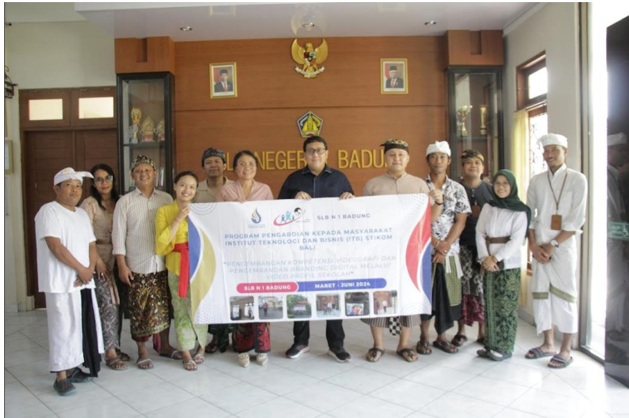
Gambar 8. Penutupan Program Pengabdian Kepada Masyarakat

Video profil yang dihasilkan mampu menggambarkan secara efektif komitmen sekolah terhadap pendidikan inklusif dan pengembangan keterampilan siswa berkebutuhan khusus. Melalui visualisasi yang menarik dan informatif, video ini berhasil memperkenalkan SLB Negeri 1 Badung kepada calon mitra dan masyarakat luas. Penggunaan media visual yang profesional dan menarik membuat pesan tentang visi dan misi sekolah serta program-program pendidikan yang ditawarkan dapat tersampaikan dengan jelas. Keterlibatan siswa berkebutuhan khusus dalam proyek videografi ini memberikan mereka pengalaman baru. Pengalaman ini tidak hanya memperkaya pengetahuan dan keterampilan tetapi juga meningkatkan rasa percaya diri mereka dalam menghadapi tantangan baru. Sesi pelatihan dan pembekalan yang diadakan selama proyek ini juga bermanfaat bagi guru. Dengan mendapatkan pengetahuan dan keterampilan dalam videografi, para guru kini memiliki kemampuan tambahan yang dapat digunakan dalam kegiatan pembelajaran lainnya (Refialy et al., 2022). Kemampuan ini memungkinkan guru untuk menciptakan konten pembelajaran yang lebih kreatif dan interaktif, yang pada gilirannya dapat meningkatkan kualitas pendidikan di SLB Negeri 1 Badung (Tumanggor et al., 2023).