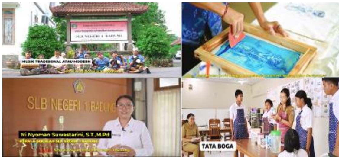
Gambar 7. Tangkapan Layar Hasil Final Video yang Dipublikasikan di Kanal Media Digital Sekolah

Tahap selanjutnya adalah publikasi dan distribusi. Video profil akan diluncurkan dalam acara resmi di sekolah untuk memperkenalkan video kepada seluruh warga sekolah dan mitra. Selain itu, video juga akan dipublikasikan di platform online seperti situs web sekolah dan media sosial, untuk menjangkau audiens yang lebih luas. Video ini juga akan digunakan sebagai bahan promosi dalam berbagai acara dan kegiatan, seperti seminar, workshop, dan pameran pendidikan.