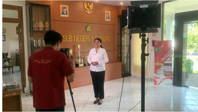
Gambar 4. Pengambilan Footage Bersama Pihak Sekolah

naskah. Siswa juga terlibat dalam proses ini untuk memberikan mereka pengalaman langsung. Selain pengambilan gambar, tim juga akan melakukan wawancara dengan kepala sekolah untuk memberikan perspektif yang lebih luas tentang sekolah. Setelah semua footage terkumpul, tim akan menyunting video untuk membuat video profil yang informatif dan menarik, memastikan video memiliki narasi yang jelas dan visual yang berkualitas.