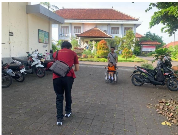
Gambar 3. Pelatihan Lapangan Bersama Pihak Sekolah