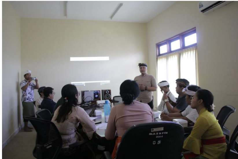
Gambar 6. Pemaparan Hasil Draft Video untuk Dievaluasi