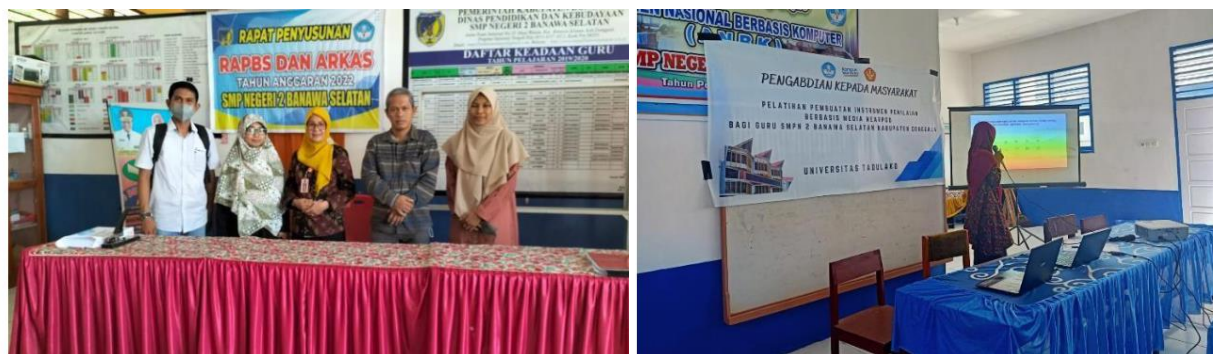
Gambar 2. Pelaksanaan Pelatihan

Setelah presentasi dari narasumber, tim pengabdian kemudian melakukan pendampingan pada mitra dalam hal pembuatan bahan ajar hingga evaluasi di nearpod. Kegiatan pendampingan (Gambar 2) dilakukan untuk memastikan bahwa materi/teknologi yang disampaikan kepada mitra dapat dilaksanakan dengan baik sehingga hasil yang diperoleh dapat mencapai sasaran.