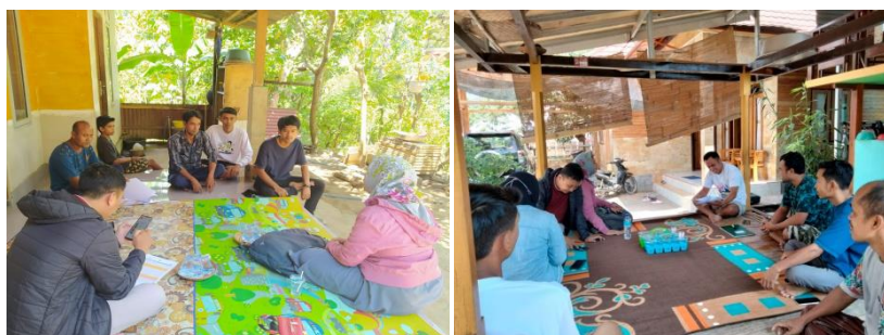
Gambar 3. Tahapan persamaan persepsi dan penentuan jadwal kegiatan pelatihan