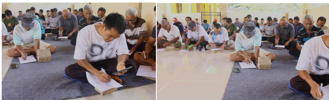
Gambar 6. Pemberian pretest dan posttest pada peserta pelatihan

Dari gambar 7 terlihat indikator pencapaian pelatihan ini sebagai berikut yaitu indikator Pencapaian Kesuksesan Pelatihan Penguatan Manajemen Kelompok Tani mencakup tingkat partisipasi petani, persentase yang mampu merencanakan, mengorganisasikan, melaksanakan, melakukan pengendalian, dan membuat laporan terlihat sangat aktif dan partisipatif terlihat dari jumlah orang yang menjawab pertanyaan pada soal dengan benar pada saat sebelum melakukan pelatihan dan setelah melakukan pelatihan terlihat jumlah petani yang sudah paham lebih banyak dibanding sebelumnya baik mengenai data riil produksi petani di Indonesia dan Lombok Utara, masalah yang sedang dihadapi dan solusi yang perlu dilakukan. Sebelumnya total petani yang menjawab dengan benar minimal diatas 6 pertanyaan dari 10 pertanyaan yang diberikan sejumlah 28 orang namun setelah diberikan pelatihan terdapat 60 orang yang mampu menjawab dengan benar minimal 6 pertanyaan dari 10 pertanyaan (TERCAPAI).