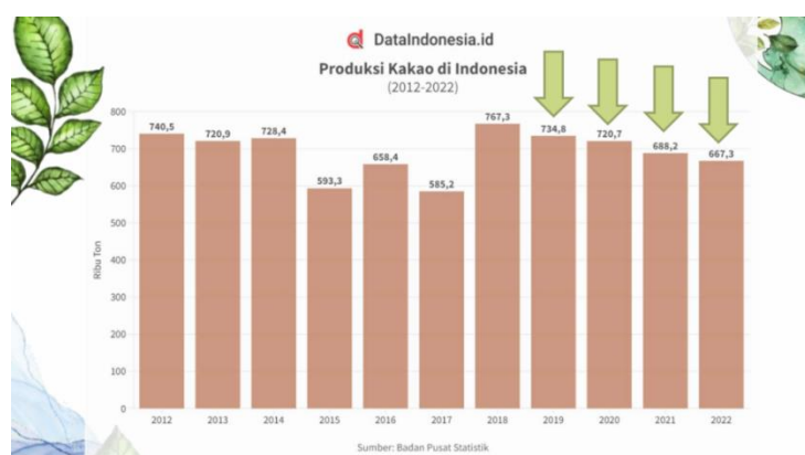
Gambar 4. Tampilan data produksi kakao di Indonesia materi pelatihan yang diberikan