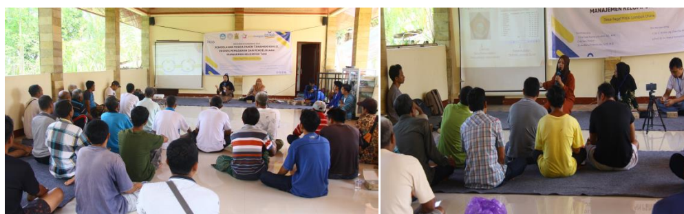
Gambar 7. Gambaran keaktifan peserta saat pemberian Pelatihan

Selain itu melakukan evaluasi dari hasil pelatihan yang telah dilakukan yaitu berupa umpan balik terhadap beberapa pertanyaan yang diberikan tim pengabdian kepada peserta. Berikut dokumentasi kegiatan pelatihan dan pendampingan yang telah diadakan: