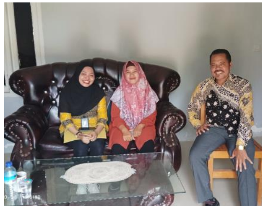
Gambar 2. Koordinasi dengan Kepala Desa Tegal Maja Lombok Utara