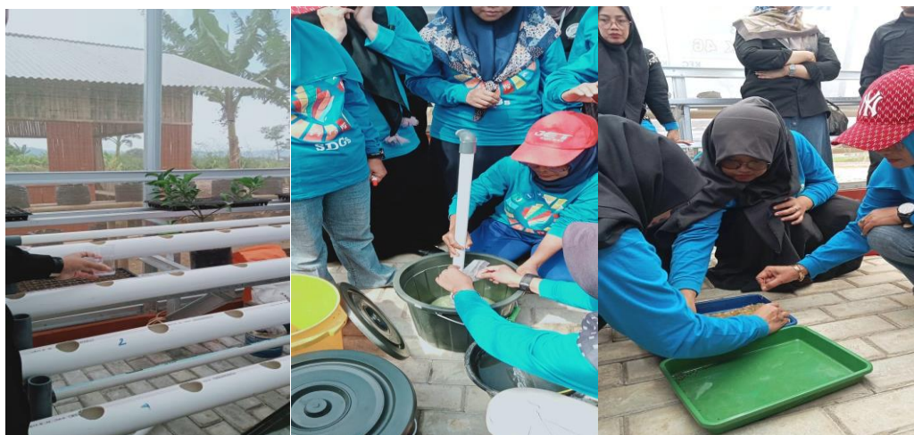
Gambar 3. Demonstrasi dan Praktek

Pada tahap Demonstrasi, peneliti memberikan contoh Teknik pembuatan instalasi hidroponik menggunakan pipa, Teknik pembuatan net pot dari gelas atau botol bekas minuman, Teknik pembenihan agar tidak mengalami kegagalan dan Teknik menyiapkan sumber nutrisi untuk pertumbuhan tanaman hidroponik. Teknik yang dipaparkan pada tahap demonstrasi merupakan Teknik sederhana sehingga dapat dengan mudah setiap tahapannya diikuti oleh peserta. Pada tahap ini juga ditunjukkan alat dan bahan yang dibutuhkan dalam budidaya tanaman hidroponik, diantaranya yaitu pipa, net pot (gelas atau botol bekas minuman), benih sayuran, sumbu, rockwool dan nutrisi AB mix.