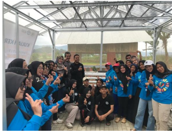
Gambar 4. Kegiatan Pelatihan

stok secara langsung (Atmira, et.all, 2022). Peserta juga melakukan praktek untuk menyiapkan rockwool sebagai media pertumbuhan benih sayuran sebelum dipindahkan ke media hidroponik.