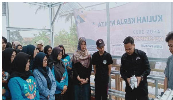
Gambar 2. Pemaparan materi

Pada tahap Demonstrasi, peneliti memberikan contoh Teknik pembuatan instalasi hidroponik menggunakan pipa, Teknik pembuatan net pot dari gelas atau botol bekas minuman, Teknik pembenihan agar tidak mengalami kegagalan dan Teknik menyiapkan sumber nutrisi untuk pertumbuhan tanaman hidroponik. Teknik yang dipaparkan pada tahap demonstrasi merupakan Teknik sederhana sehingga dapat dengan mudah setiap tahapannya diikuti oleh peserta. Pada tahap ini juga ditunjukkan alat dan bahan yang dibutuhkan dalam budidaya tanaman hidroponik, diantaranya yaitu pipa, net pot (gelas atau botol bekas minuman), benih sayuran, sumbu, rockwool dan nutrisi AB mix.