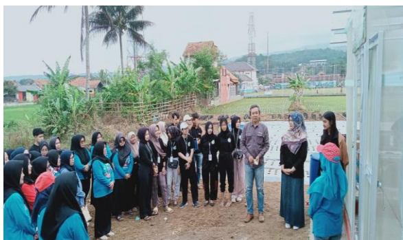
Gambar 1. Pemaparan materi

Kegiatan pelatihan ini diikuti oleh Ibu-Ibu kelompok Wanita tani dan Masyarakat Desa Kasturi sejumlah 25 peserta. Kegiatan dilakukan di Green House milik Desa yang telah dimanfaatkan sebelumnya sebagai tempat budidaya sayur dalam skala kecil. Pada tahap Presentasi dilakukan pemaparan materi oleh Tim peneliti mengenai dampak negative limbah plastic bagi lingkungan jika tidak dibuang dengan benar atau dimanfaatkan dengan baik; Teknik budidaya tanaman hidroponik, dan Teknik pembuatan media hidroponik menggunakan limbah plastic. Pada tahap ini peserta antusias dalam mengikuti dan menyimak materi pelatihan, hal ini ditandai dengan banyak peserta yang memberikan pertanyaan mengenai materi yang telah dipaparkan oleh peneliti.