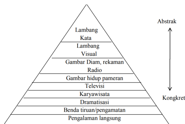
Gambar 1. Kerucut Media Pembelajaran

Dale menggambarkan pemahaman seseorang dapat dibentuk seperti kerucut dimana semakin konkret suatu materi maka konsep tersebut dapat lebih mudah dipahami. Untuk mencapai itu media pembelajaran berperan dalam penyajiannya. Berikut kerucut dale mengenai media pembelajaran.